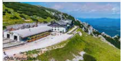
Salamander-Zug mit 111 Sitzplätzen